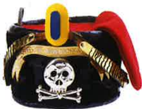
Colback du 17 ème régiment de Hussards

La collection, restaurée lors de la rénovation du musée en 2004, est constituée en grande partie par des objets laissés par les soldats sur le champ de bataille ou par des dons de leurs descendants (armement, uniformes, bronzes, lithographies, huile sur toile...).