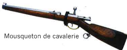
Mousqueton de cavalerie