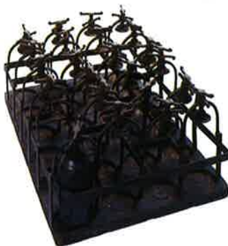
Panier de transport d'obus

Pourquoi la guerre de 1870 a-t-elle bouleversé l'équilibre du monde ?