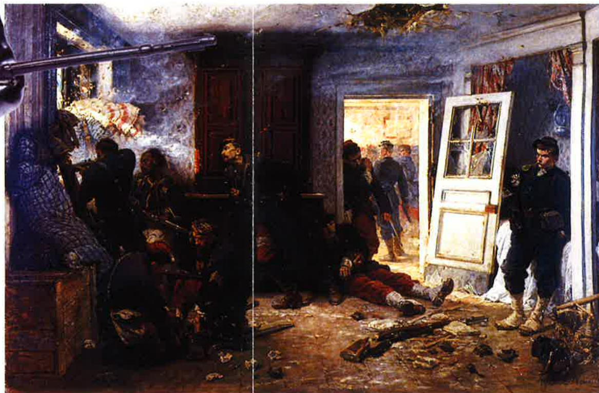
Tableau d'Alphonse de Neuville.

La défense de l'auberge Bourgerie immortalisée par ce célèbre tableau "les dernières cartouches" exposé au Salon de 1873 à Paris.