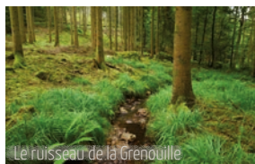
Le ruisseau de la Grenouille