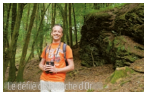
Le défilé de la Roche d'Or