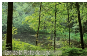
Lac de la Piste de luge