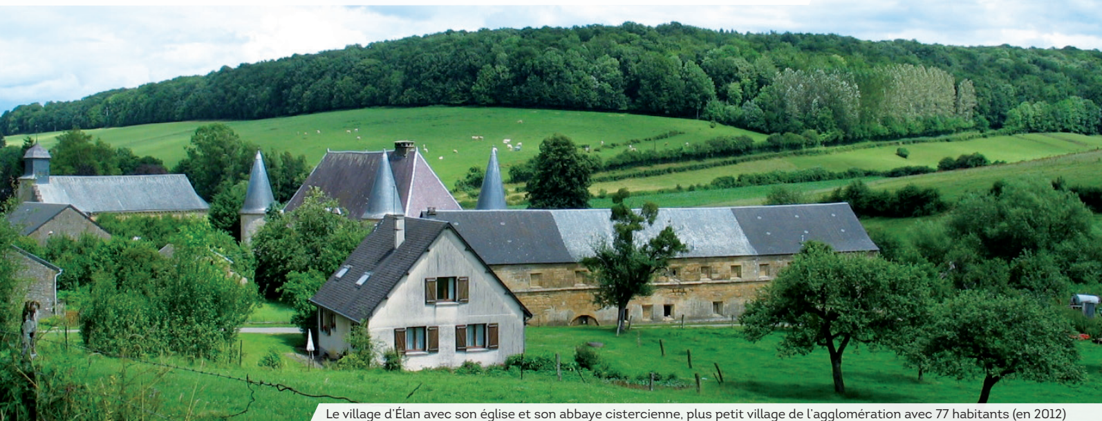
Le village d'Élan avec son église et son abbaye cistercienne, plus petit village de l'agglomération avec 77 habitants (en 2012)

Aiglemont Arreux Les Ayvelles Balaives-et-Butz Balan Bazeilles Belval Bosseval-et-Briancourt Boutancourt Chalandry-Élaire La Chapelle Charleville-Mézières Chéhéry Cheveuges Cliron Daigny Damouzy Dom-le-Mesnil Donchery Élan Étrépigny Fagnon Fleigneux Flize Floing Francheval La Francheville Gernelle Gespunsart Givonne Glaire La Grandville Hannogne-Saint-Martin Haudrecy Houldizy Issancourt-et-Rumel Illy Lumes La Moncelle Montcy-Notre-Dame Neufmanil Nouvion sur Meuse Nouzonville Noyers-Pont-Maugis Pouru-aux-Bois Pouru-Saint-Rémy Prix-lès-Mézières Rubécourt-et-Lamécourt Saint-Aignan Saint-Laurent Saint-Menges Sapogne-Feuchères Sécheval Sedan Thelonne Tournes Villers-Cernay Villers-Semeuse Villers-sur-Bar Ville-sur-Lumes Vivier-au-Court Vrigne-aux-Bois Vrigne-Meuse Wadelincourt Warcq