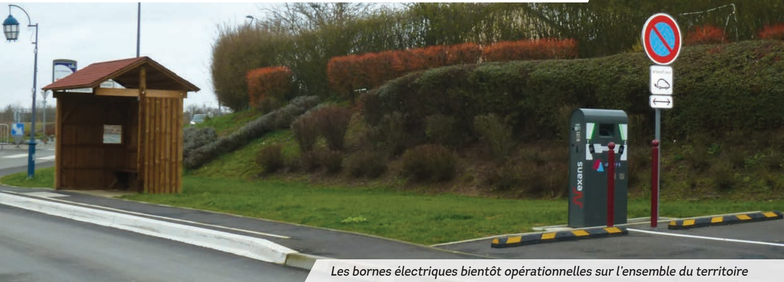
Les bornes électriques bientôt opérationnelles sur l'ensemble du territoire

Aiglemont Arreux Les Ayyvelles Balaives-et-Butz Balan Bazeilles Belval Boutancourt Chalandry-Élaire La Chapelle Charleville-Mézières Cheveuges Cliron Daigny Damouzy Dom-le-Mesnil Donchery Élan Étrépiigny Fagnon Fleigneux Flize Floing Francheval La Francheville Gernelle Gespunsart Givonne Glaire La Grandville Hannogne-Saint-Martin Haudrecy Houldizy Issancourt -et-Rumel Illy Lumes La Moncelle Montcy-Notre-Dame Neufmanil Nouvion sur Meuse Nouzoville Noyers-Pont-Maugis Poureu-aux-Bois Poureu-Saint-Rémy Prix-lès-Mézières Saint-Aignan Saint-Laurent Saint-Menges Sapogne-Feuchères Sécheval Sedan Thelonne Tournes Villers-Semeuse Villers-sur-Bar Ville-sur-Lumes Vivier-au-Court Vrigne-aux-Bois Vrigne-Meuse Wadelincourt Warcq