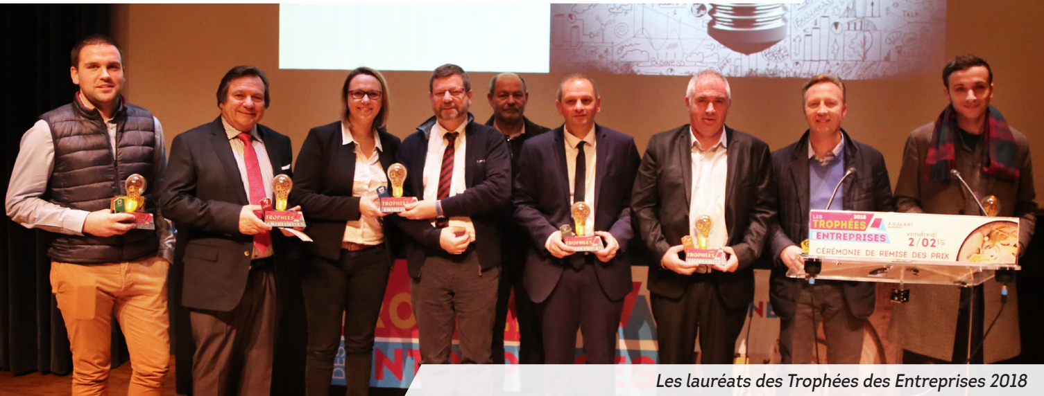
Les lauréats des Trophées des Entreprises 2018