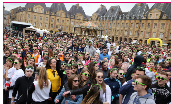
Gacolor sur la place Ducale, le 1 er avril 2018, rendez-vous festif incontournable pour les étudiants du territoire