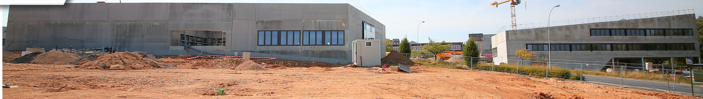
Sur le chantier du campus, le gros œuvre s'achève... La maison des étudiants est la plus avancée et sa livraison est toujours prévue pour la fin d'année. Côté pôle formations de la CCI, on en est au cloisonnement intérieur, quant à l'extension de l'IUT, sa couverture sera entièrement posée à la mi-septembre. À l'extérieur, la passerelle de liaison entre la CCI et l'IUT a été également exécutée en totalité et la dernière grue aura disparue à la fin du mois.