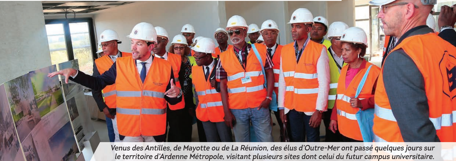
Venus des Antilles, de Mayotte ou de La Réunion, des élus d'Outre-Mer ont passé quelques jours sur le territoire d'Ardenne Métropole, visitant plusieurs sites dont celui du futur campus universitaire.