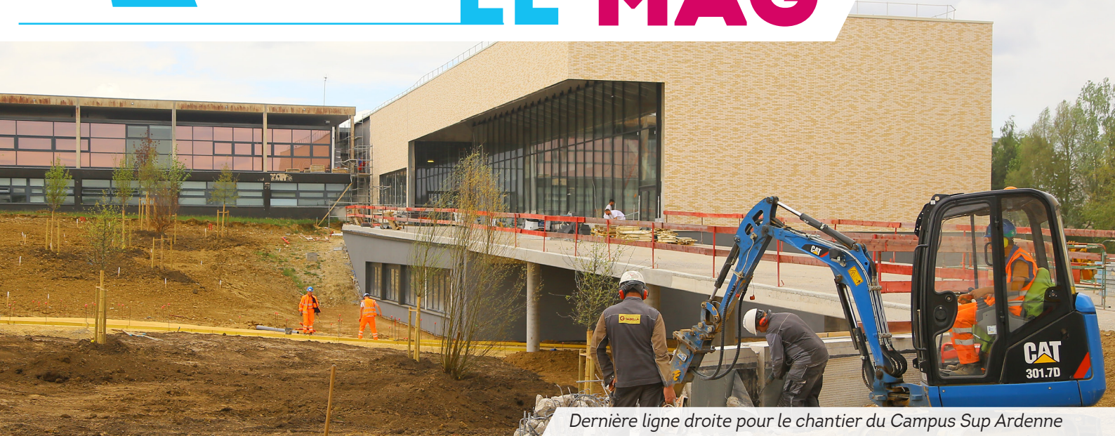
Dernière ligne droite pour le chantier du Campus Sup Ardenne