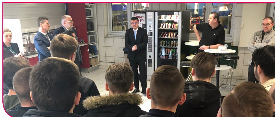
ID-REP Electronic, groupe Alphitan est lauréate des trophées des entreprises 2019 Ardenne Métropole - catégorie export.

Réparation électronique industrielle, espace robots pour test, recherche et développement pour répondre aux besoins des clients et ceux à venir, reconstruction de composantes... il faut sans cesse se renouveler.