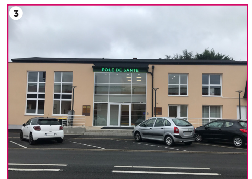
Les maisons de santé de Nouvion-sur-Meuse ① (ouverte en 2017), de Flize ② et Prix-lès-Mézières ③ (ouvertes en janvier dernier et inaugurées en septembre).

2 ARRÊTS DESSERVIS 72 FOIS PAR JOUR : Campus Sup Ardenne (ligne 2C) et Moulin Leblanc (lignes 2 et 8)