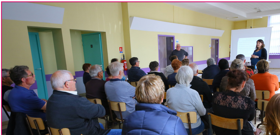
Réunion d'information préalable à l'utilisation d'un composteur.

Plus d'infos : service prévention et collectes des déchets 0800 29 83 55 - prevention-dechets@ardenne-metropole.fr