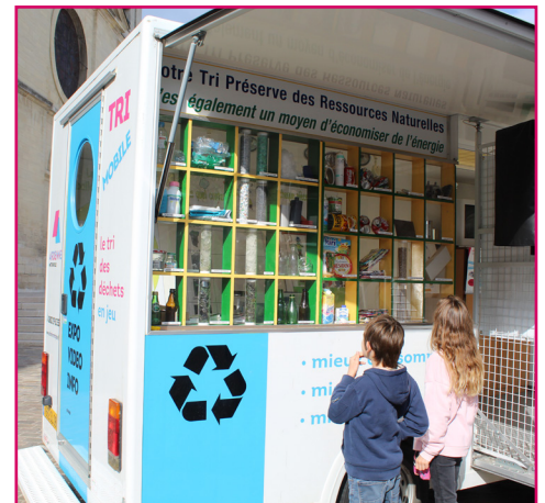
Le Tri Mobile sillonne le territoire pour informer et acquiescer les bons gestes.