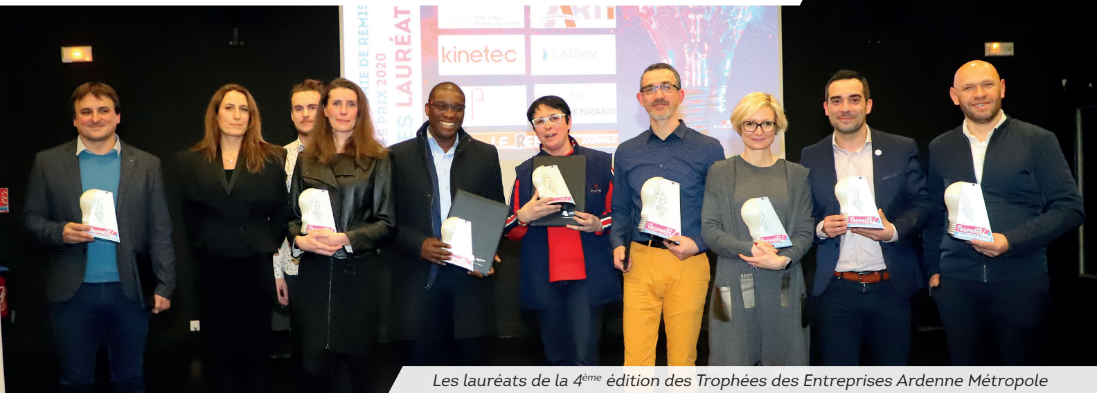
Les lauréats de la 4 ème édition des Trophées des Entreprises Ardenne Métropole

Aiglemont Arreux Les Ayvelles Balan Bazeilles Belval Chalandry-Élaire La Chapelle Charleville-Mézières Cheveuges Cliron Daigny Damouzy Dom-le-Mesnil Donchery Étrépnigny Fagnon Fleigneux Flize Floing Francheval La Francheville Gernelle Gespunsart Givonne Glaire La Grandville Hannogne-Saint-Martin Haudrecy Houldizy Illy Issancourt-et-Rumel Lumes La Moncelle Montcy-Notre-Dame Neufmanil Nouvion-sur-Meuse Nouzonville Noyers-Pont-Maugis Pouru-aux-Bois Pouru-Saint-Rémy Prix-lès-Mézières Saint-Aignan Saint-Laurent Saint-Menges Sapogne-Feuchères Sécheval Sedan Thelonne Tourmes Villers-Semeuse Villers-sur-Bar Ville-sur-Lumes Vivier-au-Court Vrigne-aux-Bois Vrigne-Meuse Wadelincourt Warcq