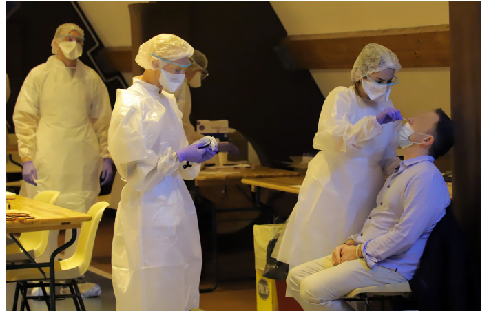
23.521 personnes testées dans les 8 centres du territoire entre le 14 et le 30 décembre

(des chambres d'hôtel avaient même été prévues pour l'occasion), d'autres non. Mais dans tous les cas, ces 1.241 porteurs du virus, désormais avertis de leur état, ont modifié leur comportement durant cette période cruciale des fêtes, évitant ainsi un désastreux effet boule de neige : loin de voir l'épidémie s'emballer, les Ardennes, tout en restant dans le rouge, ont retrouvé en janvier un niveau de diffusion de la covid-19 moins angoissant.