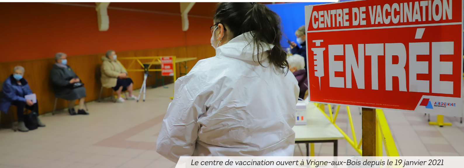
Le centre de vaccination ouvert à Vrigne-aux-Bois depuis le 19 janvier 2021