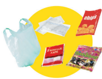
Sacs et sachets