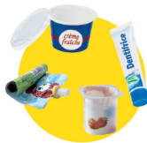
Pots et boîtes