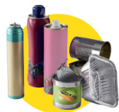
Emballages en métal