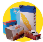
Emballages en carton