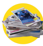
Papiers, journaux, magazines