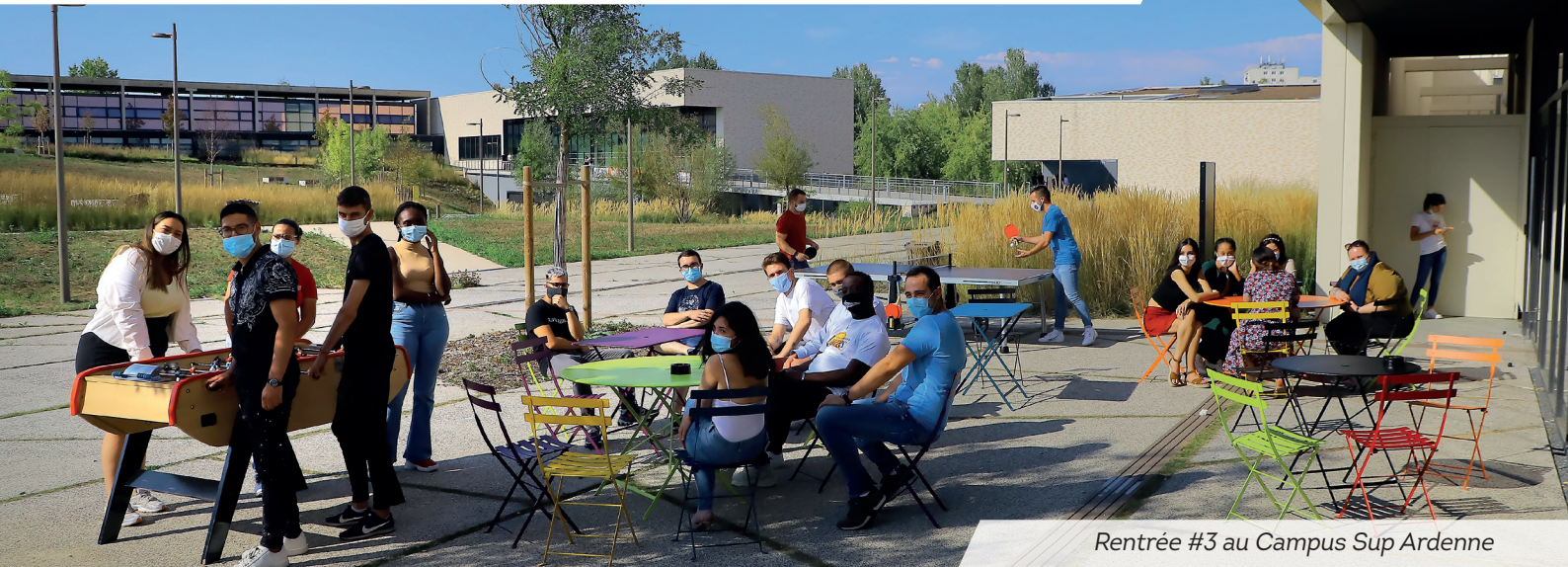
Rentrée #3 au Campus Sup Ardenne

Aiglemont Arreux Les Ayvelles Balan Bazeilles Belval Chalandry-Élaire La Chapelle Charleville-Mézières Cheveuges Cliron Daigny Damouzy Dom-le-Mesnil Donchery Étrépygnon Fagnon Fleigneux Flize Floing Francheval La Francheville Gernelle Gespunsart Givonne Glaire La Grandville Hannogne-Saint-Martin Haudrecy Houldizy Illy Issancourt-et-Rumel Lumes La Moncelle Montcy-Notre-Dame Neufmanil Nouvion-sur-Meuse Nouzonville Noyers-Pont-Maugis Pouru-aux-Bois Pouru-Saint-Rémy Prix-lès-Mézières Saint-Aignan Saint-Laurent Saint-Menges Sapogne-et-Feuchères Sécheval Sedan Thelonne Tournes Villers-Semeuse Villers-sur-Bar Ville-sur-Lumes Vivier-au-Court Vrigne-aux-Bois Vrigne-Meuse Wadelincourt Warcq