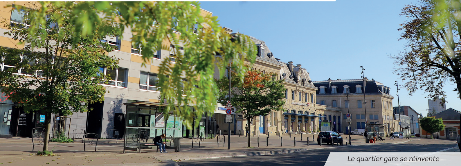
Le quartier gare se réinvente