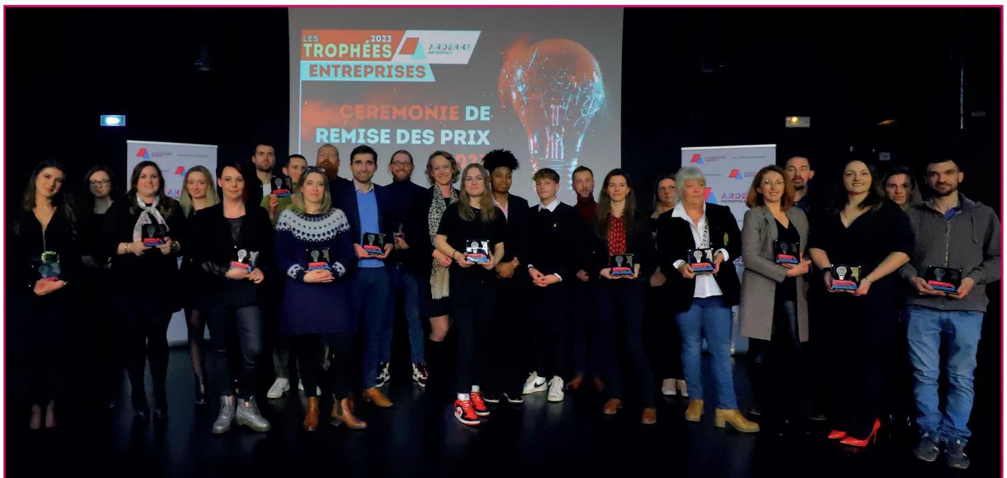
Les lauréats des Trophées 2023 - Retrouvez la promotion 2024 en photo dans Le Mag de mars

Flashez-moi et découvrez toutes nos promos